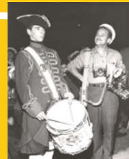
Antoine Désilets, photographe-gracieuseté de la FPJQ

Au Centre d'exposition de Val-d'Or LA FPJQ EST FIÈRE DE PRÉSENTER L'EXPOSITION DU PRIX ANTOINE-DÉSILETS 2018, LE PRIX DES MEILLEURES PHOTOS DE PRESSE DE L'ANNÉE AU QUÉBEC. LE PRIX ANTOINE-DÉSILETS A ÉTÉ LANCÉ EN 2005. IL PRÉSENTE AU PUBLIC LES MEILLEURES PHOTOGRAPHIES DE PRESSE DE L'ANNÉE AU QUÉBEC. LE PRIX COMPTE 6 CATÉGORIES: ARTS, CULTURE ET ART DE VIVRE, COUP D'ŒIL, PHOTOREPORTAGE, POLITIQUE, PORTRAIT ET SPORTS. LE JURY CHOISIT LA PHOTO DE L'ANNÉE.