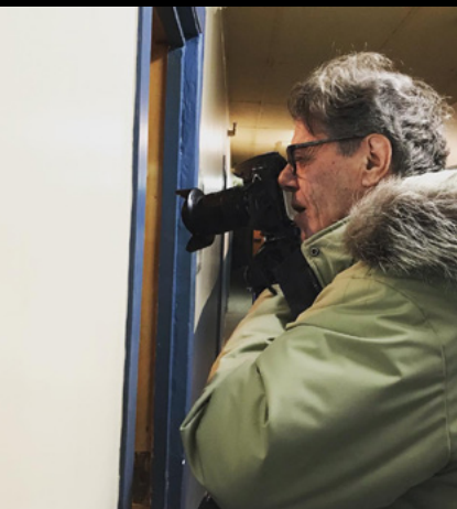
TABLE RONDE SUR L'IMAGE DE PRESSE Animée par Emélie Rivard-Boudreau, journaliste indépendante

Centre d'exposition de Val-d'Or à 17 h À UNE CERTAINE ÉPOQUE, MÊME EN ABITIBI, EXISTAIT LE MÉTIER DE PHOTOGRAPHE DE PRESSE. AUJOURD'HUI, QUE CE SOIT AVEC UN APPAREIL PHOTO OU SIMPLEMENT UN TÉLÉPHONE INTELLIGENT, LES JOURNALISTES RECUEILLENT EUX-MÊMES LEURS PROPRES PHOTOS, ET MÊME PARFOIS LEURS PROPRES IMAGES VIDÉOS. QUELLES SONT LES CARACTÉRISTIQUES PROPRES AUX IMAGES DE PRESSE? COMMENT LA CAPTATION D'IMAGES D'ACTUALITÉ A-T-ELLE ÉVOLUÉE AU FIL DES ANNÉES?